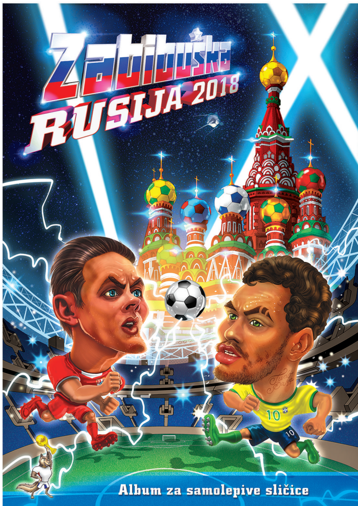
Album za samolepive sličice