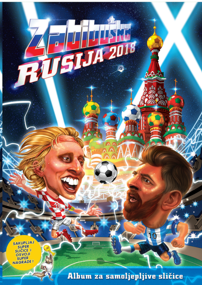
Album za samoljepljive sličice